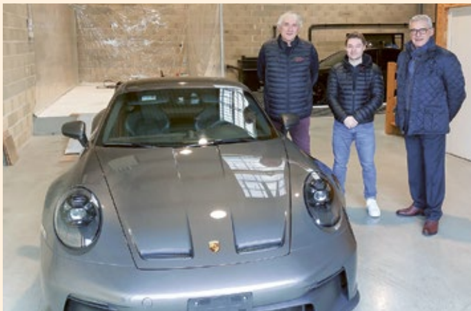
Entreprise d'esthétique automobile Détail Touch, à Gellainville.

En collaboration avec Chartres métropole depuis 2017, ce partenariat a permis de financer et d'accompagner 48 entreprises en 2023, générant ainsi 752 000 € de prêts d'honneur et le maintien ou la création de 174 emplois. Ces chiffres sont le résultat d'un travail conjoint et de proximité auprès des entrepreneurs futurs et actuels. Les créations, reprises et croissances d'aujourd'hui constituent les emplois de demain. Les deux structures avancent ensemble dans le même état d'esprit, avec les mêmes visions et les mêmes motivations, dans une démarche de développement économique soutenu et d'employabilité durable.