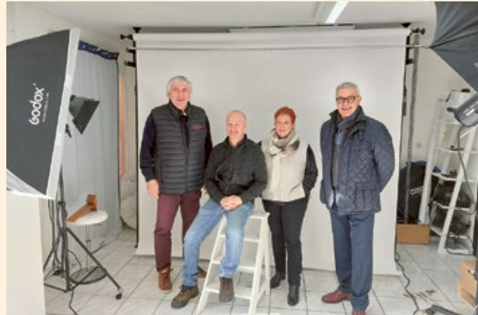
Atelier Photo Vallée, à Lèves.