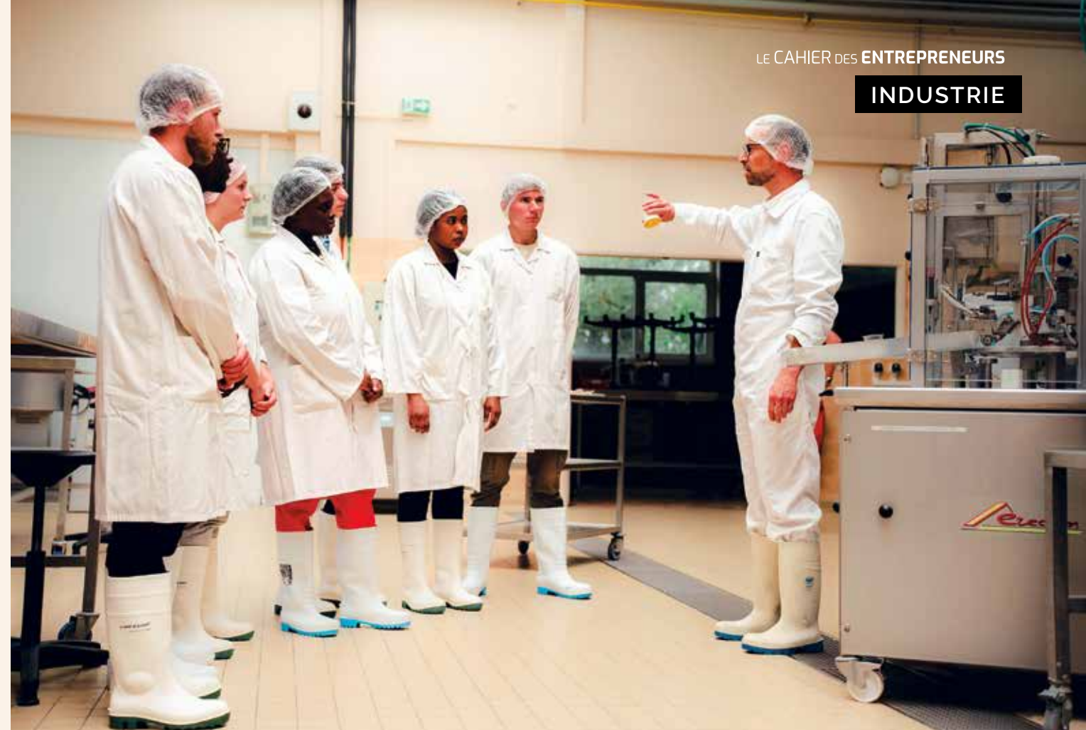
▲ Immersion à 360° au cœur des métiers des secteurs agroalimentaire, cosmétique et pharmaceutique au sein du Campus Natur'Alim de Sours.