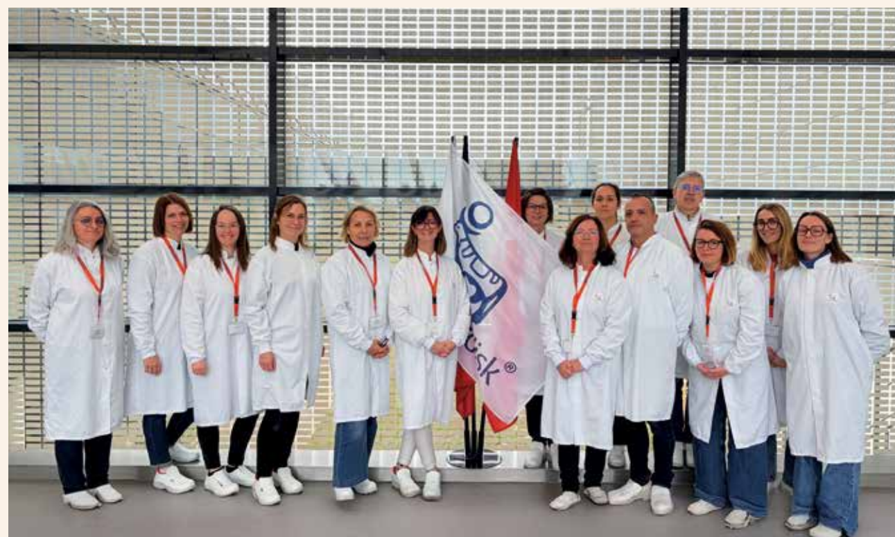
▲ Enseignants, professionnels de l'orientation et conseillers emploi en visite immersive chez Novo Nordisk.