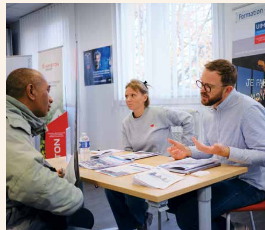
▲ Job dating à l'UIMM.

Pour répondre aux besoins croissants des entreprises industrielles locales, la semaine a également été rythmée par plusieurs temps de recrutement. Ces rendez-vous ont permis de mettre directement en relation candidats, étudiants et entreprises, confirmant une dynamique forte autour des métiers de l'industrie, notamment le job dating de l'UIMM (Industries et métiers de la métallurgie), qui a réuni 10 entreprises et 50 candidats, ou celui de la CCI 28 spécial industrie, avec 16 entreprises et 130 candidats.